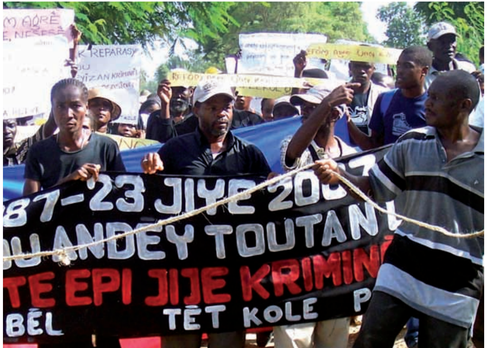
En 2007 se cumplieron 30 años de la masacre de 139 campesinos a manos de los latifundistas de Jean Rabel.

tituyen una parte importante de la organización, más de un 90% de su membresía vive exclusivamente de la agricultura, por eso la organización se esmera cada día en reivindicar una reforma agraria integral y justa y la promoción de la producción nacional.