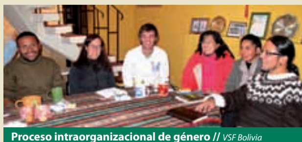
Proceso intraorganizacional de género