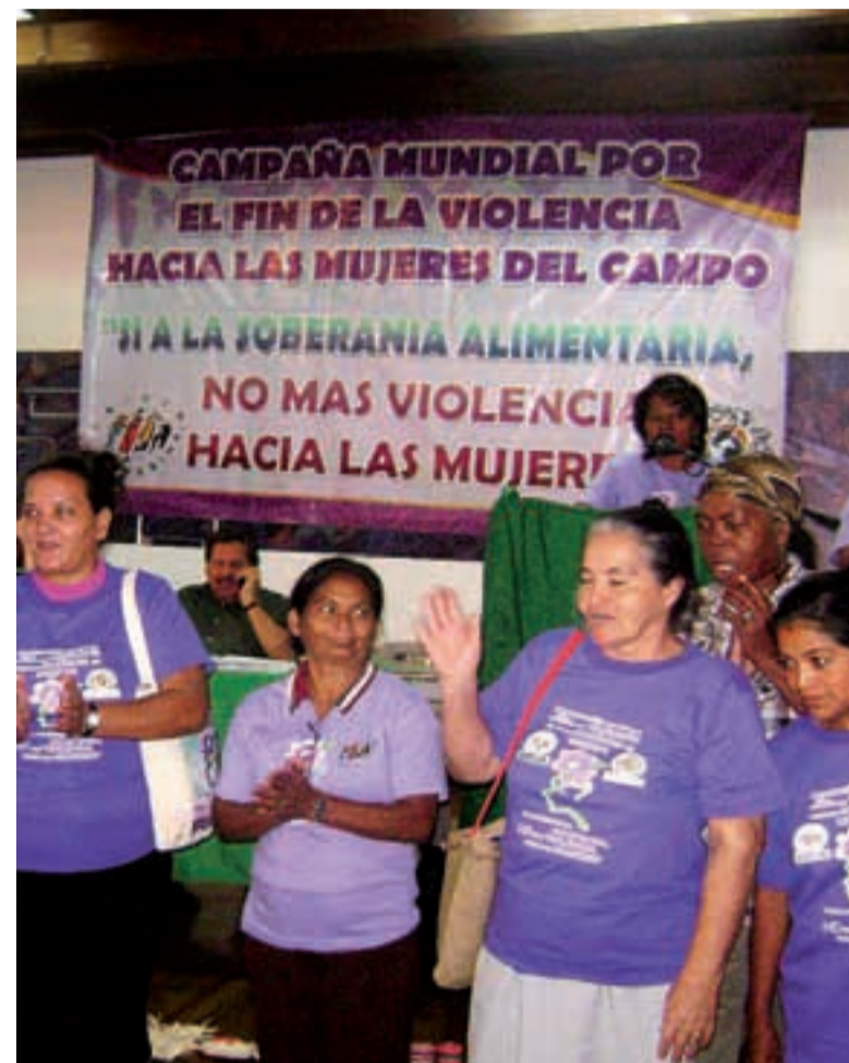
Lanzamiento en Nicaragua de la campaña mundial por el fin de la violencia hacia las mujeres del campo.

En estos últimos tres años, las mujeres de La Vía Campesina centroamericana, acompañadas por VSF, han logrado contar con un espacio propio, ser conscientes sobre la necesidad de una reforma agraria, del derecho a la soberanía alimentaria