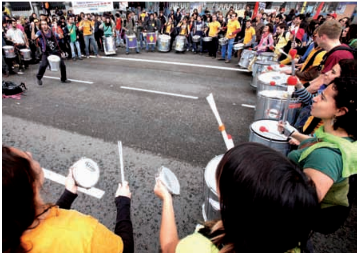
Miles de personas de todo el Estado se manifestaron contra los transgénicos el 17 de abril en Madrid.

Y el movimiento comenzó a moverse. O la conjunción de movimientos, mejor dicho, porque cada territorio sigue su ritmo, con unos mismos planteamientos pero sin dejar de ser protagonistas de su propia historia: así, en Euskadi, han surgido iniciativas como Elkar Sarea (Red de Consumo Solidario para la Soberanía Alimentaria), el Proyecto Nekasare, puesto en marcha