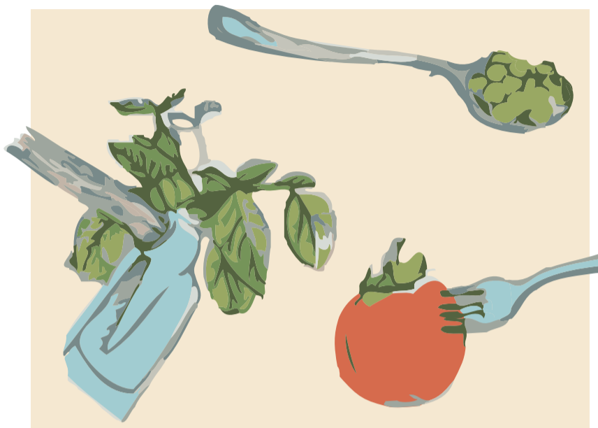
En el acto se degustaron productos como aguacates, chorizo o queso. // VSF