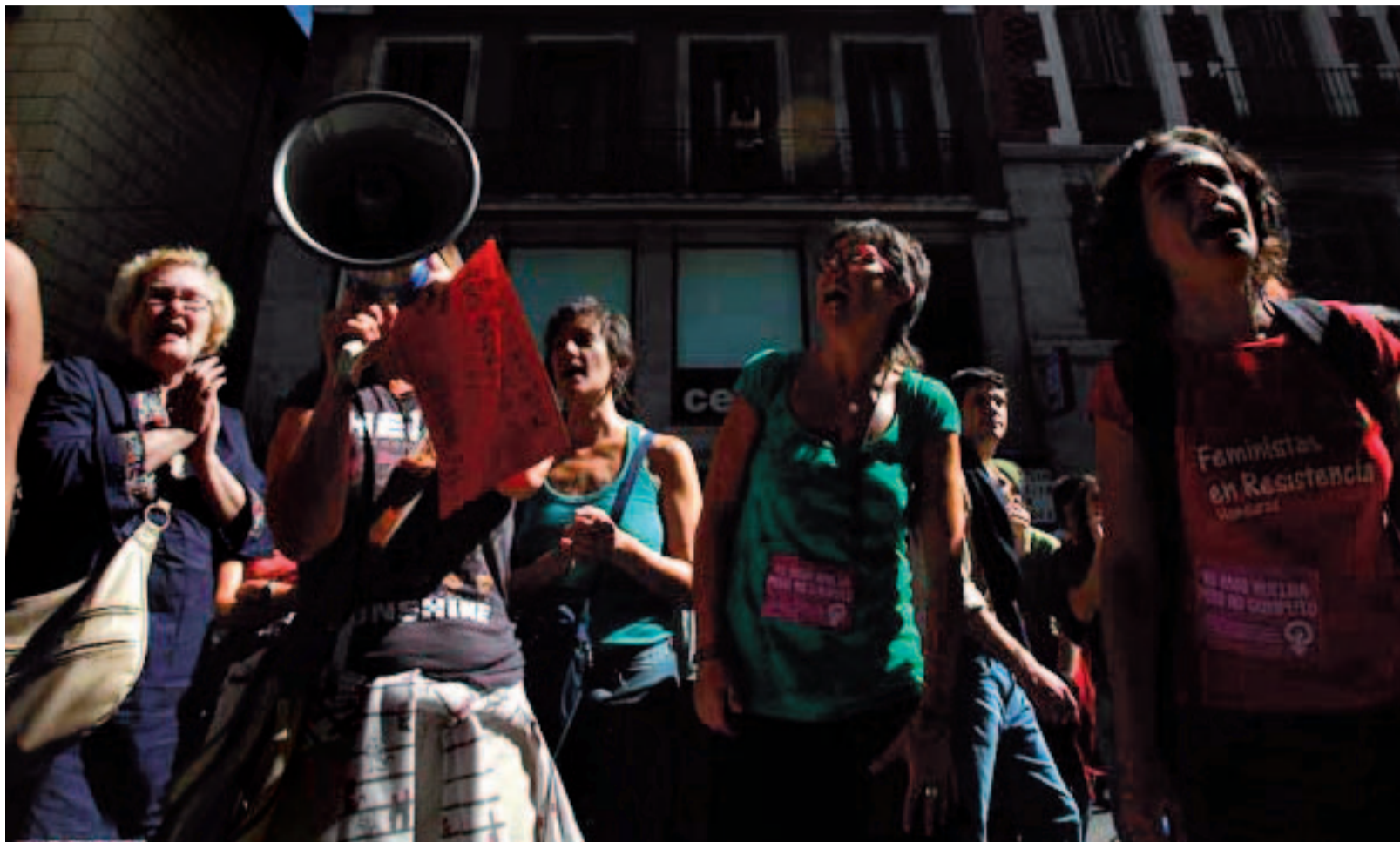
Manifestación de empleadas del hogar para lograr que se equipare su régimen con el Régimen General de la Seguridad Social.