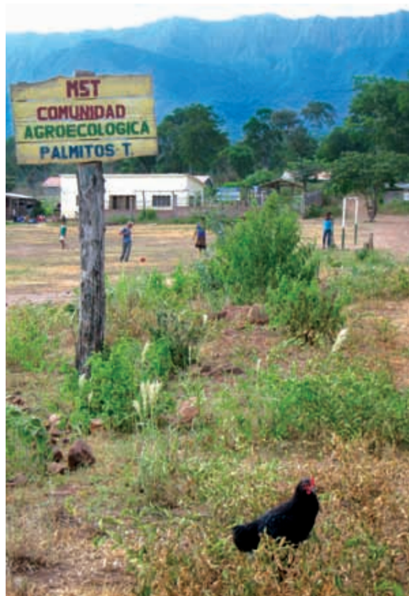
El MST-B exige que la reforma agraria se lleve a la práctica en Bolivia.

En una región así, donde el Estado no controla a los poderes locales, son las familias campesinas indígenas del Movimiento de los Trabajadores Campesinos Indígenas Sin Tierra de Bolivia (MST-B) las que se organizan para reivindicar esas tierras. Se asientan donde saben que se vuelven incómodos, pero efectivos. Las ocupaciones legales del MST-B han recordado al país que la Reforma Agraria va mucho más allá de la dotación de tierras. La verdadera Reforma Agraria necesita un marco de respeto a los derechos que permita a las familias vivir en libertad y sin la constante amenaza de