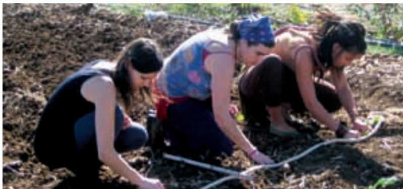
VSF Andalucía integra el enfoque de género en su labor formativa.